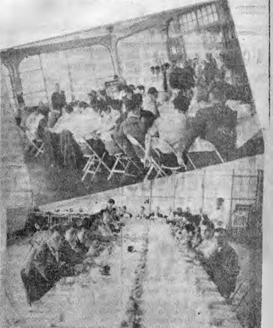
Muestran las fotos dos aspectos del banquete ofrecido ayer en el Balneario de Ojo de Agua a los integrantes del España por la Federación Nacional de Fútbol